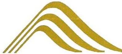
1972 Margaretha van Hennebergweg