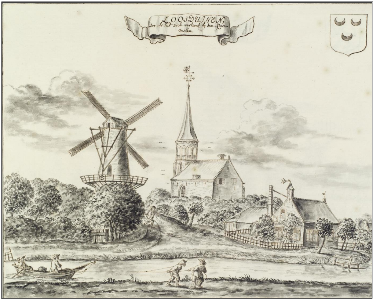
1729 Gezicht op Loosduinen met de Molen en Abdijkerk