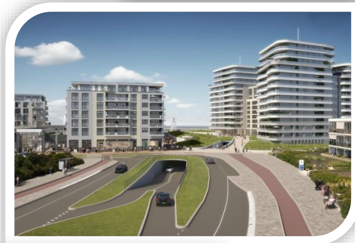
2022 Nieuw Kijkduin