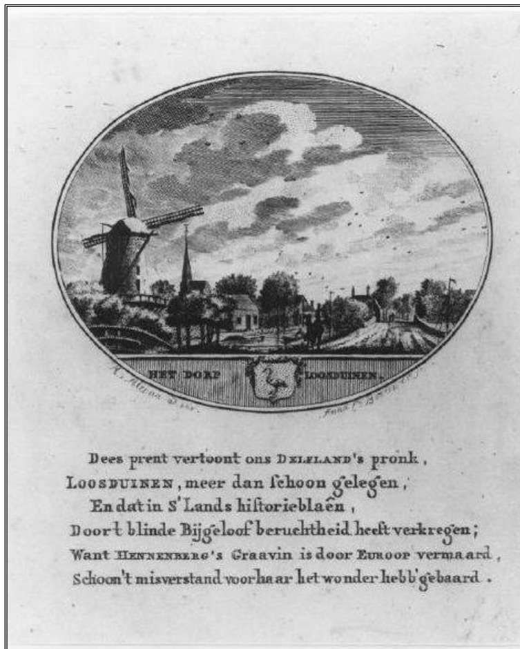
1800 Gezicht op Loosduinen